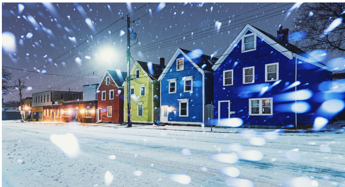
سرک مسکونی برفی، هالیفکس.

مردم بومی قبل از ورود مهاجرین و سیاحین اروپایی به کانادا در این کشور زندگی می‌کردند. هالیفکس، مانند بیشتر مناطق نووسکوشیا، در سرزمین سنتی «اقوام میکمک» (mah-Meeg) واقع شده است.