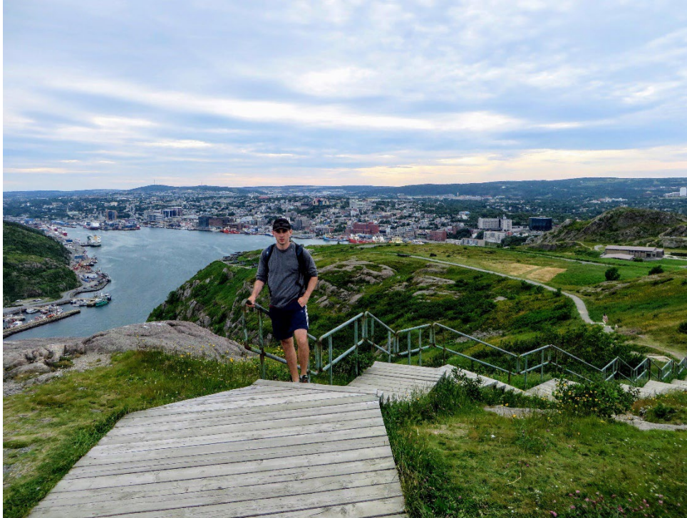
Une personne montant Signal Hill vers la tour Cabot, avec le port de St. John's à l'arrière-plan.