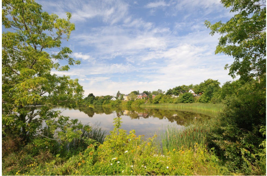
له منظر و ډک جونز جهيل، مونکتون.