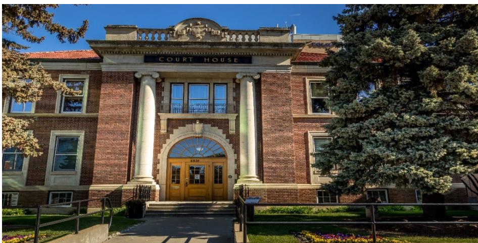
تعمیر عدلیه، تعمیر تاریخی، رد دیر، البرتا

مردم بومی قیل از ورود مهاجرین و سیاحین اروپایی به کانادا در این کشور زندگی می‌کردند. رد دیر، مانند بیشتر مناطق افریقا، در سرزمین «پیمان 7»، سرزمین سنتی مردم بلک‌فوت، تسو تینا و استونی ناکودا، قرار دارد. منطقه البرتای مرکزی جزو زمین‌های «پیمان 6»، سرزمین سنتی مردم متیس، کری و سالتی محسوب می‌شود.