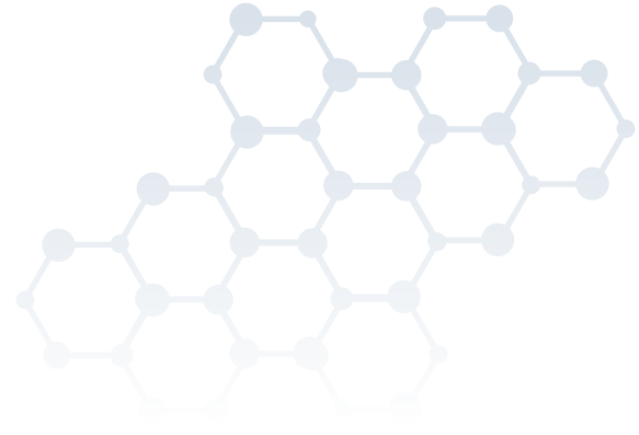
TABLE DES MATIÈRES