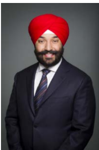
L'honorable Navdeep Bains

J'ai le plaisir de vous présenter le Plan ministériel 2018-2019 de l'APECA.