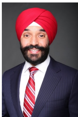
L'honorable Navdeep Bains

De concert avec les Canadiennes et les Canadiens de toutes origines, régions et générations, nous bâtissons une solide culture d'innovation pour faire du Canada un chef de file de l'économie mondiale.