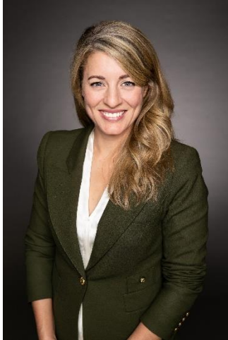
L'honorable Mélanie Joly Ministre du Développement économique et des Langues officielles

Grâce à toutes ces initiatives et à d'autres encore, nous continuons à réaliser notre engagement, soit favoriser une économie dynamique et en croissance qui crée des emplois, de nouvelles possibilités et une meilleure qualité de vie pour toutes les Canadiennes et tous les Canadiens.