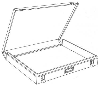
Figure 2. Boîte Solander.

manipulation des œuvres. On peut inscrire les renseignements quant au contenu sur l'extérieur de la boîte (figure 2).