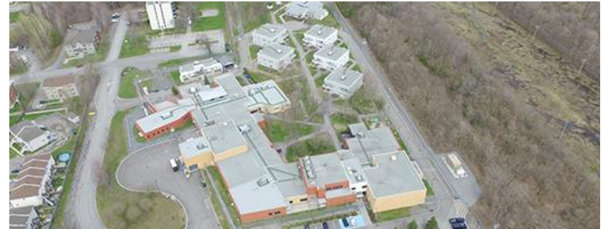
Établissement Joliette pour femmes Joliette, Québec - Capacité des délinquantes : 132