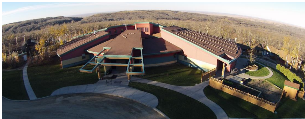
Pavillon de ressourcement Okimaw Ohci Maple Creek, Saskatchewan Capacité des délinquantes : 60