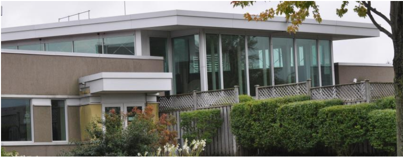
Établissement pour femmes Grand Valley Kitchener, Ontario - Capacité des délinquantes : 215