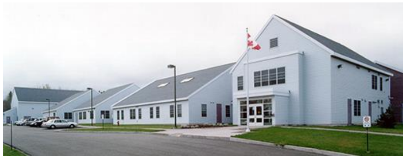
Établissement Nova pour femmes Truro, Nouvelle Écosse - Capacité des délinquantes : 99