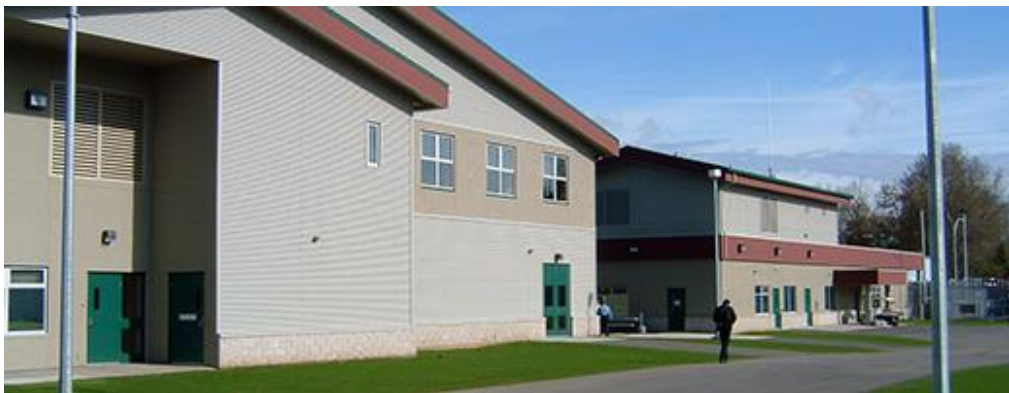
Établissement de la vallée du Fraser pour femmes Abbotsford, Colombie britannique Capacité des délinquantes : 112