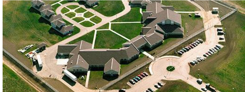
Établissement d'Edmonton pour femmes Edmonton, Alberta - Capacité des délinquantes : 167