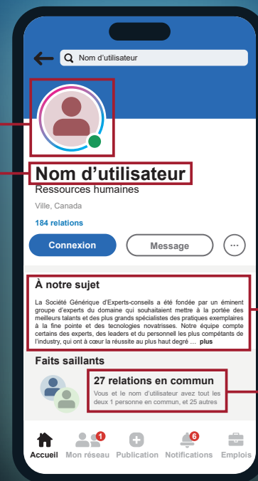
Photo de profil

Avant d'accepter une nouvelle demande dans les médias sociaux, prenez l'habitude d'examiner le profil du demandeur.