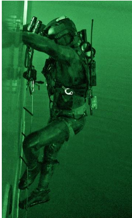
Un membre du COMFOSCAN anime une formation en Colombie-Britannique, septembre 2021.