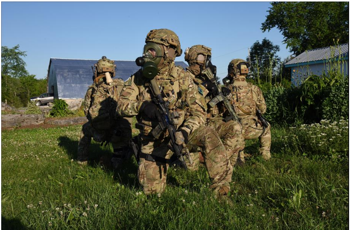
Des membres du Commandement des Forces d'opérations spéciales du Canada dirigent une instruction en Ontario, en juin 2022.