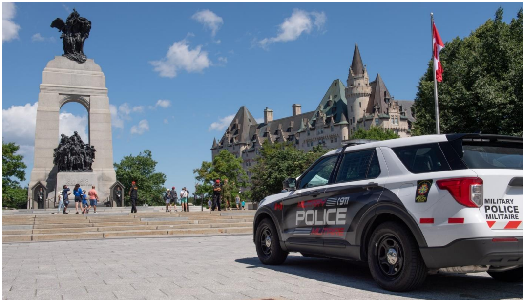
La police militaire assure la protection des membres des FAC qui gardent la Tombe du Soldat inconnu au Monument commémoratif de guerre du Canada à Ottawa (Ontario) au cours de l'été 2022.

Le traitement rapide et efficace des habilitations de sécurité à l'appui des opérations demeure une priorité absolue. Le MDN et les FAC cerneront les risques pour la sécurité dans le cadre de l'exécution du programme de sécurité du MDN, ce qui permettra au MDN et aux FAC de prendre à l'égard des risques pour la sécurité des décisions fondées sur des données probantes qui appuient l'exécution du Programme des services de la Défense. Un rapport de mise en œuvre du plan de sécurité ministériel (PSM) de l'AF 2021-2024 sera produit, tout en respectant les jalons annuels pour la poursuite de la mise en œuvre et le renouvellement du plan en 2025. La mise en œuvre du PSM se concentrera sur la gestion positive des risques de sécurité stratégiques et leurs plans de traitement des risques associés, afin de mieux s'aligner sur la gestion des risques d'entreprise. Le MDN et les FAC adapteront et moderniseront également leur programme de sécurité en tenant compte des leçons retenues et des changements fondamentaux provoqués par la pandémie de la COVID-19. Ils poursuivront la mise en œuvre du programme actualisé de gestion de la continuité des activités par la conduite délibérée et fédérée d'analyses des répercussions sur les opérations au niveau ministériel, en utilisant des outils automatisés et une gouvernance proactive pour gérer efficacement les services essentiels.