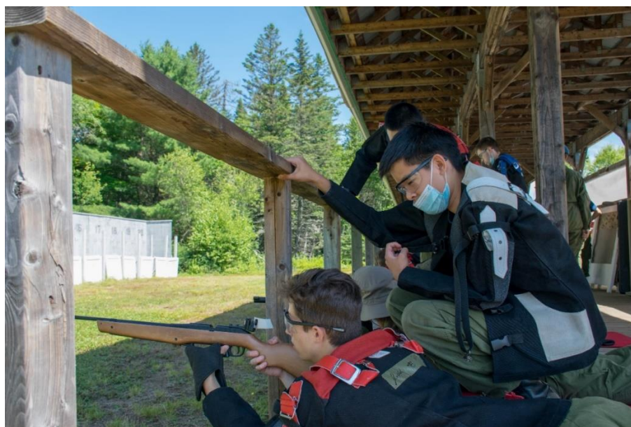
Un cadet supérieur entraîne un cadet subalterne au Centre d'instruction des cadets de Valcartier en août 2022.

L'Équipe de la Défense, en référence spécifique à l'Armée canadienne, offrira un programme de leadership pour les jeunes autochtones, Eagle's Nest. L'Armée canadienne soutiendra également les sessions d'instruction améliorées des Rangers juniors canadiens comme le Camp Loon.