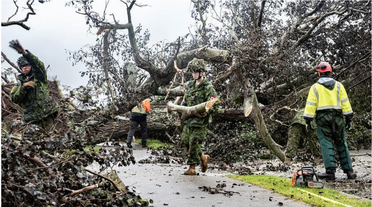
Des membres des FAC répondent à la demande d'aide de la province de la Nouvelle-Écosse dans le cadre de l'opération LENTUS clxvii , à la suite de l'ouragan Fiona qui a eu lieu le 24 septembre 2022.