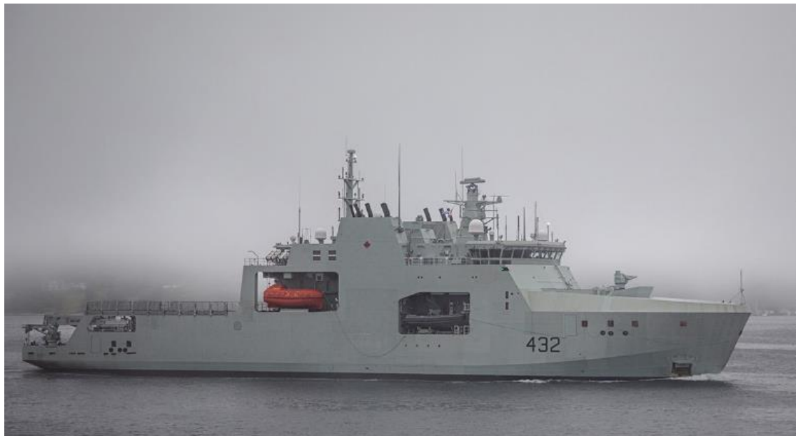
Le NCSM Max Bernays, troisième navire de patrouille extracôtier et de l'Arctique, rentre au port après avoir effectué des essais en mer à Halifax, en Nouvelle-Écosse.