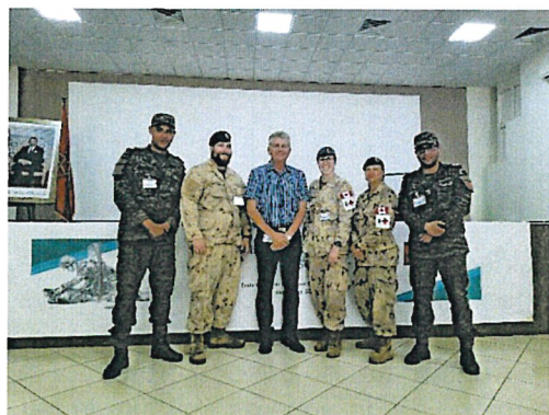
Cours de secourisme en situation de combat au Maroc.

activités sont menées à l'étranger; certaines par l'entremise de centres d'excellence en Jamaïque. En 2021-2022, malgré les restrictions liées à la pandémie, le PICM a été en mesure de donner des cours sur la gestion des ressources de la défense, l'élaboration et la mise en œuvre de l'apprentissage à distance, l'intégration des femmes et le point de vue tenant compte des différences entre les sexes dans les forces armées, les compétences en matière de soins médicaux en situation de combat et les compétences relatives à la marine et à la force aérienne (chef de quart à la passerelle, capitaine d'armes et instructeur de pilotes). À l'avenir, pour une meilleure harmonisation des mandats stratégiques du PICM en matière de diplomatie de défense et de renforcement des capacités, l'accent sera mis sur le perfectionnement professionnel des officiers supérieurs, tandis que le perfectionnement professionnel pour les grades inférieurs diminuera.