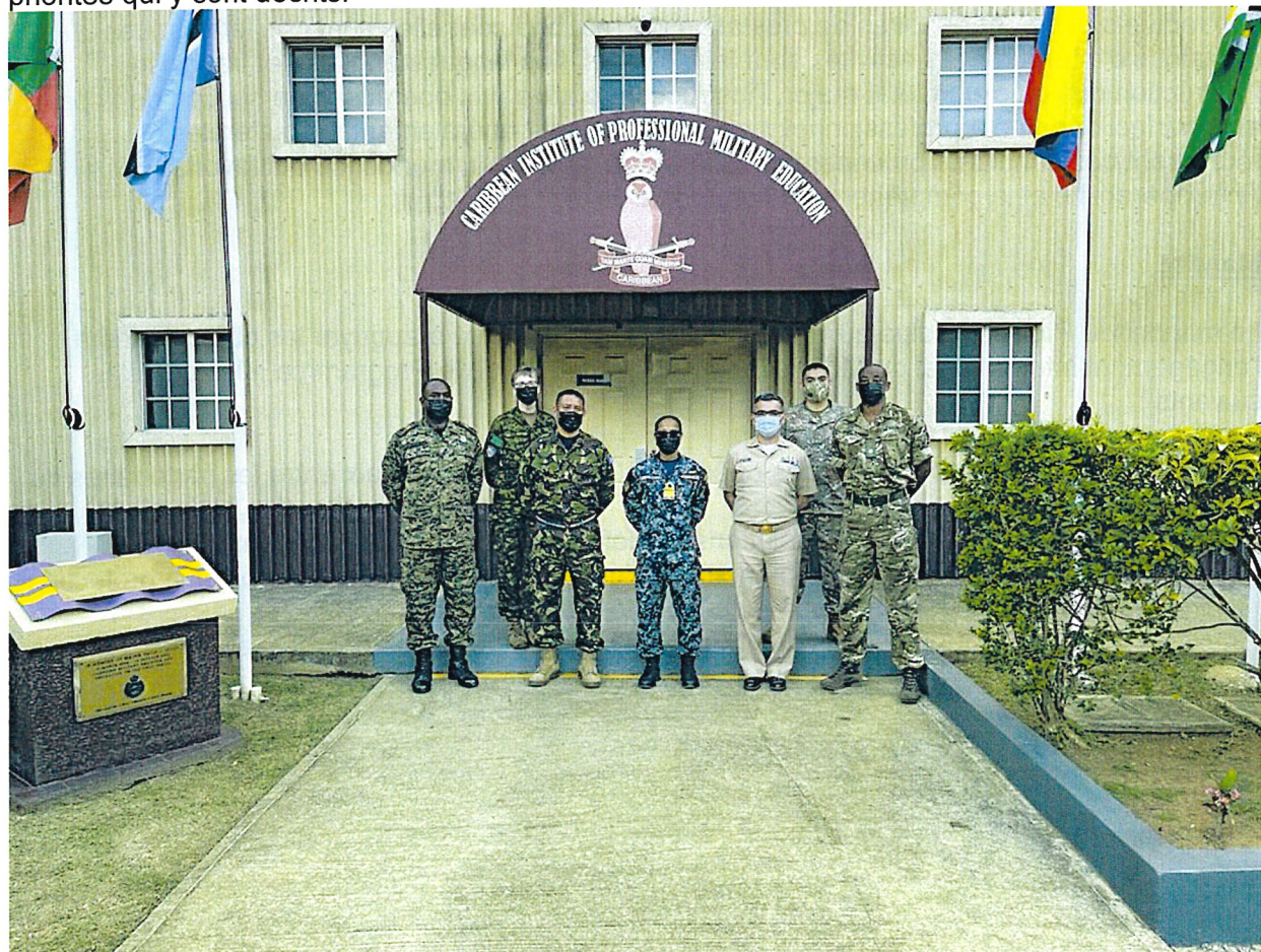
Le personnel d'instruction international du PICM et le chef d'état-major de la défense des forces de défense de la Jamaïque au Caribbean Military Academy (académie militaire des Caraïbes)

La SEM fournit une orientation sur les secteurs géographiques d'intérêt en ce qui concerne la diplomatie de défense et souligne l'importance du renforcement des capacités comme outil d'engagement international. Le PICM appuie les intérêts stratégiques, les objectifs et les priorités qui y sont décrits.