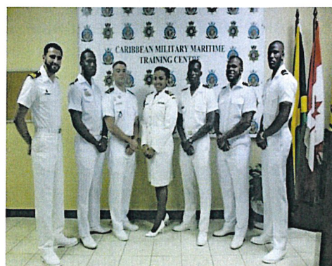
Cours de chef de quart à la passerelle en Jamaïque.