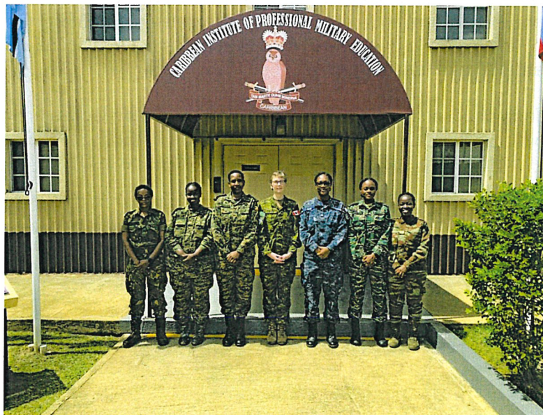
Journée internationale des femmes dans le cadre du Junior Command and Staff Leadership Programme (programme élémentaire de commandement et d'état-major) en Jamaïque, avec des stagiaires du Bénin, du Guyana, de Trinité-et-Tobago, de l'Ouganda et du Malawi.

Outre l'atelier IWGPAF, d'autres activités du PICM traitent du recoupement entre les sexes et la sécurité, notamment l'instruction des cadres supérieurs au Canada, l'instruction relative aux opérations de soutien de la paix et le cours d'aumônerie et de résilience.