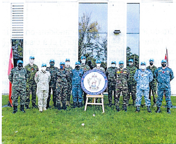
Cours d'observateur militaire des Nations Unies au Centre de formation pour le soutien de la paix à Kingston, au Canada.