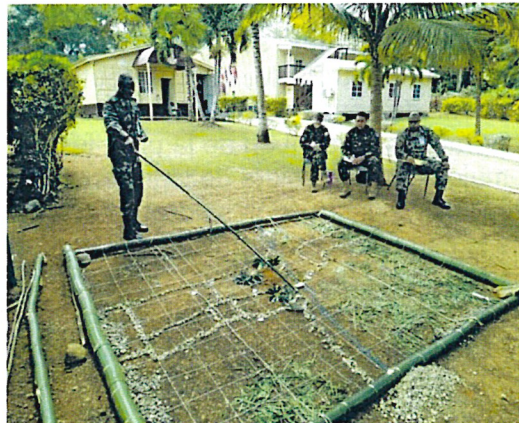
Séance d'information sur le plan d'opération présenté à l'aide d'un modèle de carte : personnel d'instruction du Belize, du Canada et de la Jamaïque avec des stagiaires de la Colombie, du Guyana, de Trinité-et-Tobago et de l'Ouganda.

Le PICM travaille en collaboration avec le Collège des Forces canadiennes (CFC), le Collège de commandement et d'état-major de l'Armée canadienne (CCEMAC) et d'autres centres d'excellence pour parrainer et offrir l'instruction des officiers d'état-major aux pays membres chaque année. Ces cours, qui durent généralement de plusieurs mois à un an, préparent les officiers à exercer des fonctions d'état-major dans des environnements de coalitions interarmées et multinationales. Les cours sont très demandés et le nombre de places est très limité. Les stagiaires sont donc sélectionnés de manière stratégique. En 2021-2022, le PICM a été en mesure d'offrir des places dans le Programme de sécurité nationale, le Programme de commandement et d'état-major interarmées, le cours de perfectionnement du commandement de la Marine royale canadienne au Canada et le Junior Command and Staff Leadership Programme (programme élémentaire de commandement et d'état-major) en Jamaïque.