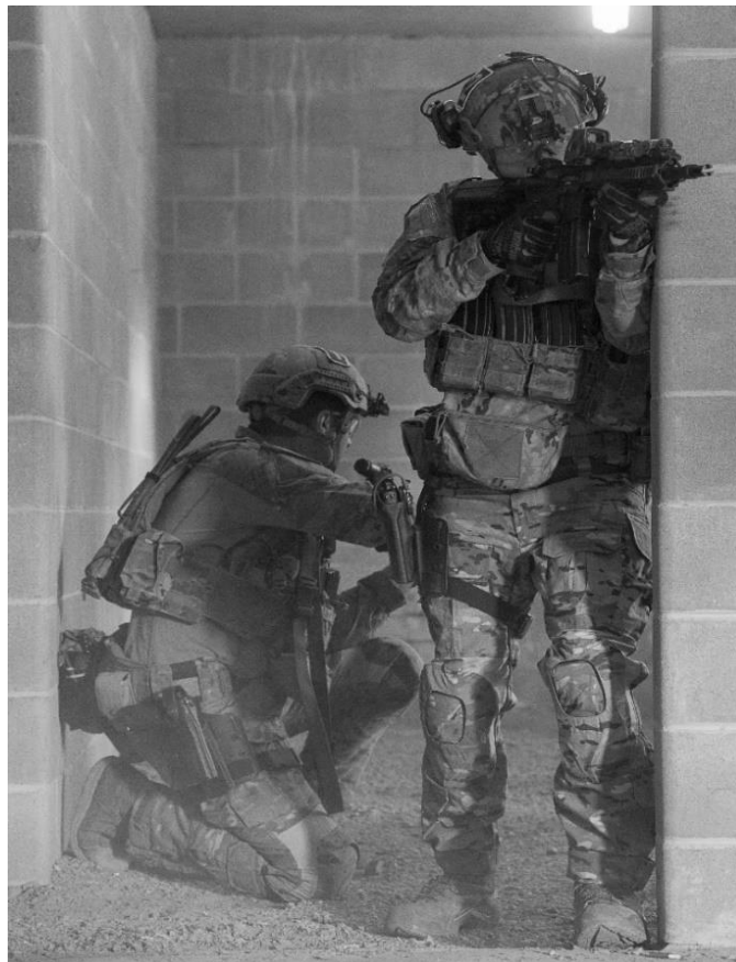
Deux membres du Commandement des Forces d'opérations spéciales du Canada (COMFOSCAN) effectuent un combat rapproché lors d'un entraînement à la Base des Forces canadiennes Petawawa (Ontario), en septembre 2022.