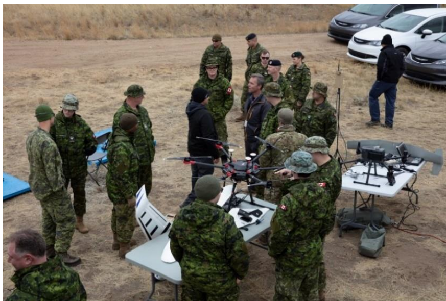
Des membres des Forces armées canadiennes et des civils observant des drones de l'équipe rouge.