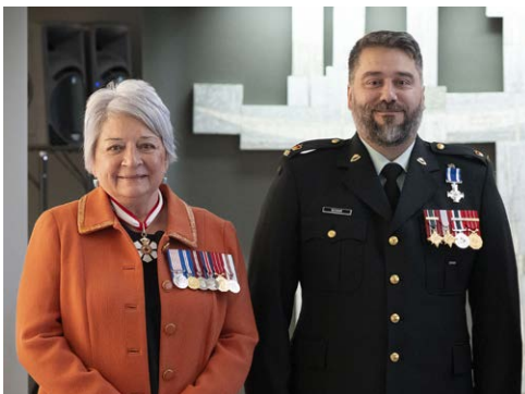
Major Maxime Joseph Jean-Pierre Bossé, CD, receives the Meritorious Service Cross from the Governor General, La Citadelle, 6 October 2025.

Major Maxime Joseph Jean-Pierre BOSSÉ, CD En tant qu'ingénieur interarmées au quartier général de la Force opérationnelle Lettonie depuis juillet 2022, le major Bossé a fait preuve d'un leadership inégalé dans la mise sur pied d'infrastructures pour le Groupement tactique de la présence avancée renforcée, ainsi que dans la planification des besoins en matière d'infrastructures pour la future brigade. Sa capacité à traiter de questions délicates dans un environnement extrêmement difficile a permis l'acquisition de biens immobiliers essentiels à la croissance de la brigade. Les efforts remarquables du major Bossé ont beaucoup renforcé la crédibilité du Canada à titre de pays-cadre en Lettonie.