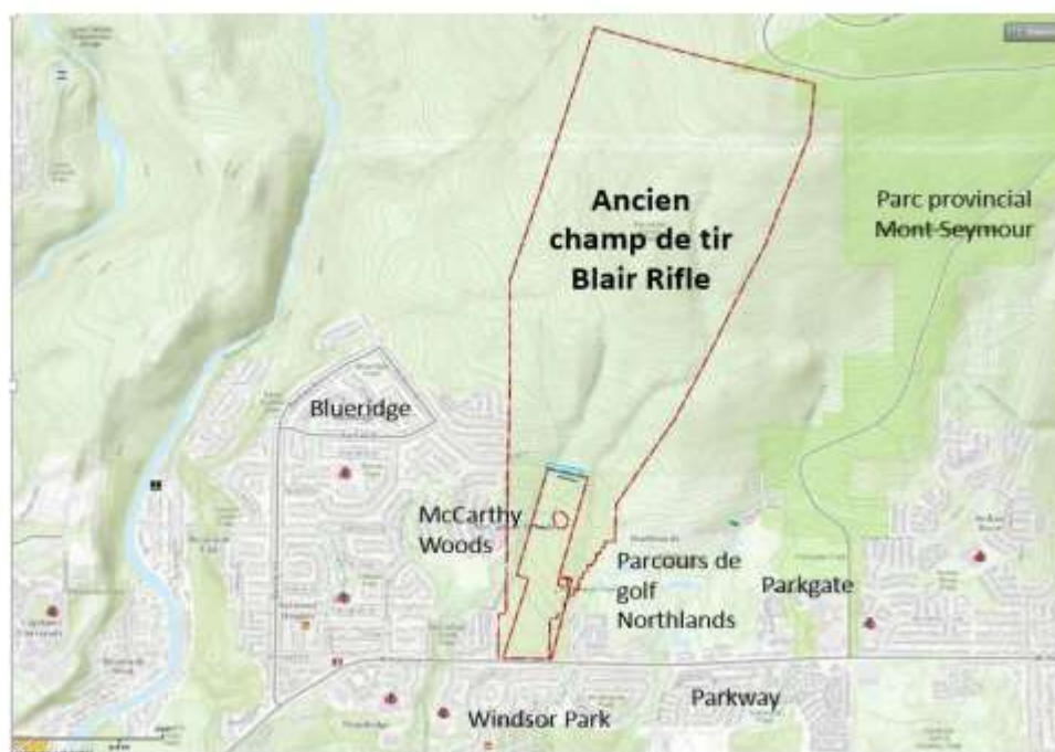
Figure 1 – Carte de l'ancien champ de tir Blair et des communautés avoisinantes. De gauche à droite : Blueridge, McCarthy Woods, Windsor Park, terrain de golf Northlands, Parkgate, Parkway et parc provincial du Mont Seymour.

Si vous avez des questions au sujet des activités du MDN liées aux UXO à l'ancien champ de tir Blair, n'hésitez pas à communiquer avec nous à l'adresse suivante : UXOCanada@forces.gc.ca .