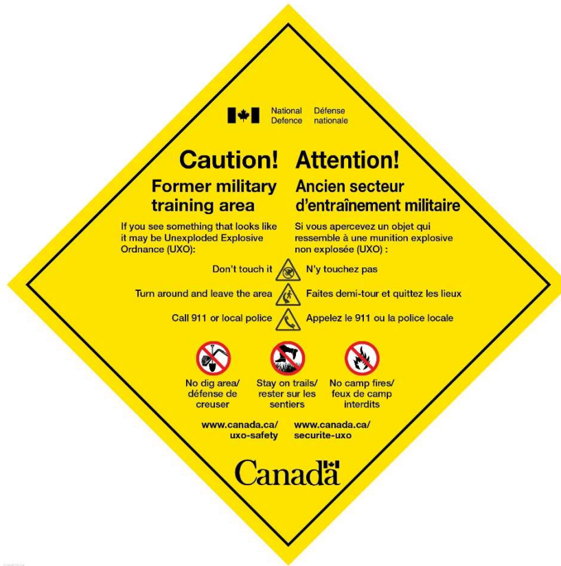
Figure 4 – Panneau de mise en garde au sujet des UXO