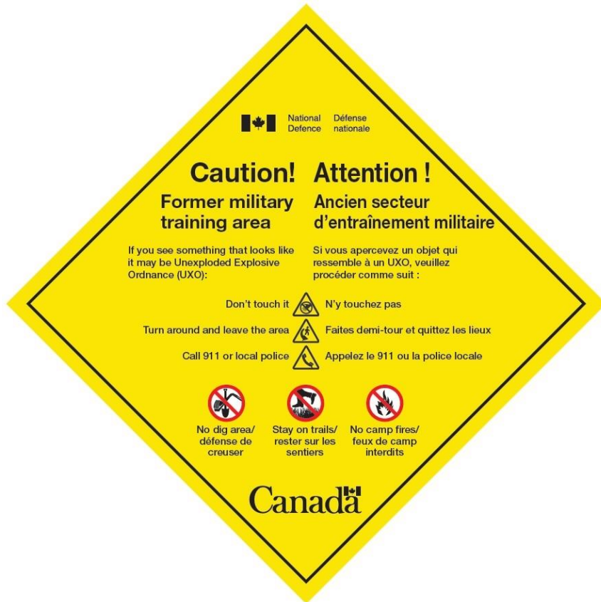
Figure 2 – Panneau de sécurité UXO