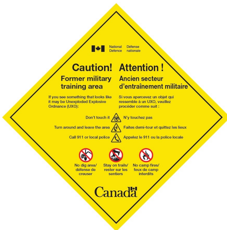
Figure 2 – Panneau de sécurité UXO