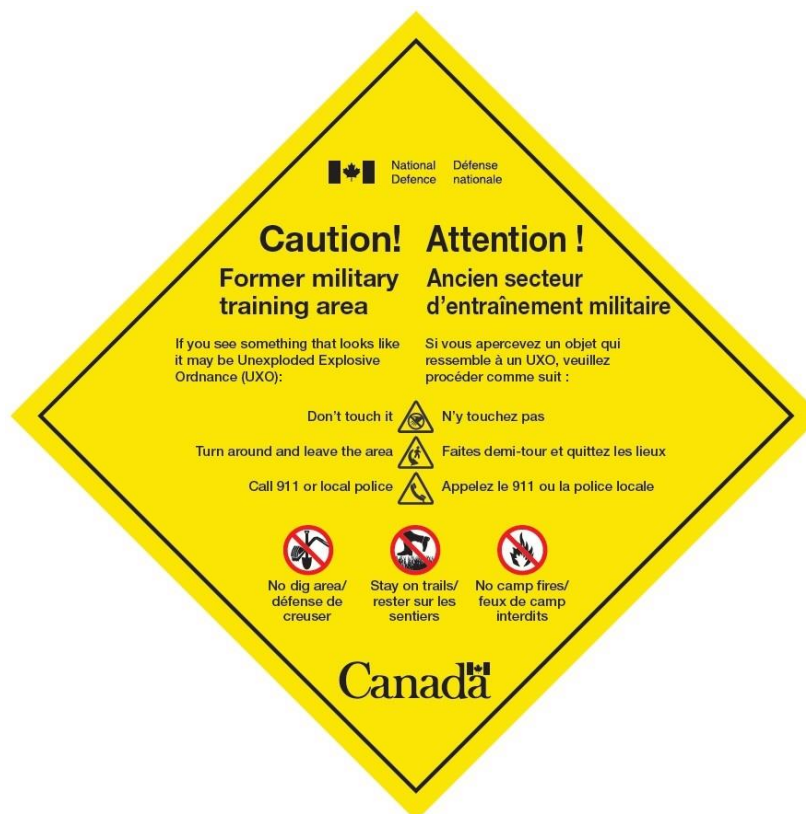
Figure 2 – Panneau de sécurité pour les UXO