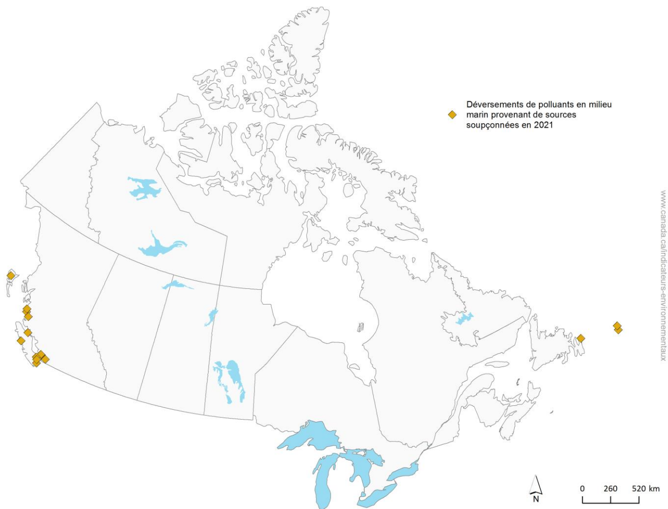
Figure 4. Déversements de polluants en milieu marin provenant de sources soupçonnées, Canada, 2021

Remarque : Pour l'année 2021, seuls les déversements de plus de 10 litres ont été signalés. Le terme « année » fait référence aux exercices financiers, qui s'étendent du 1er avril au 31 mars. L'année 2021 commence donc le 1er avril 2020 et se termine le 31 mars 2021.