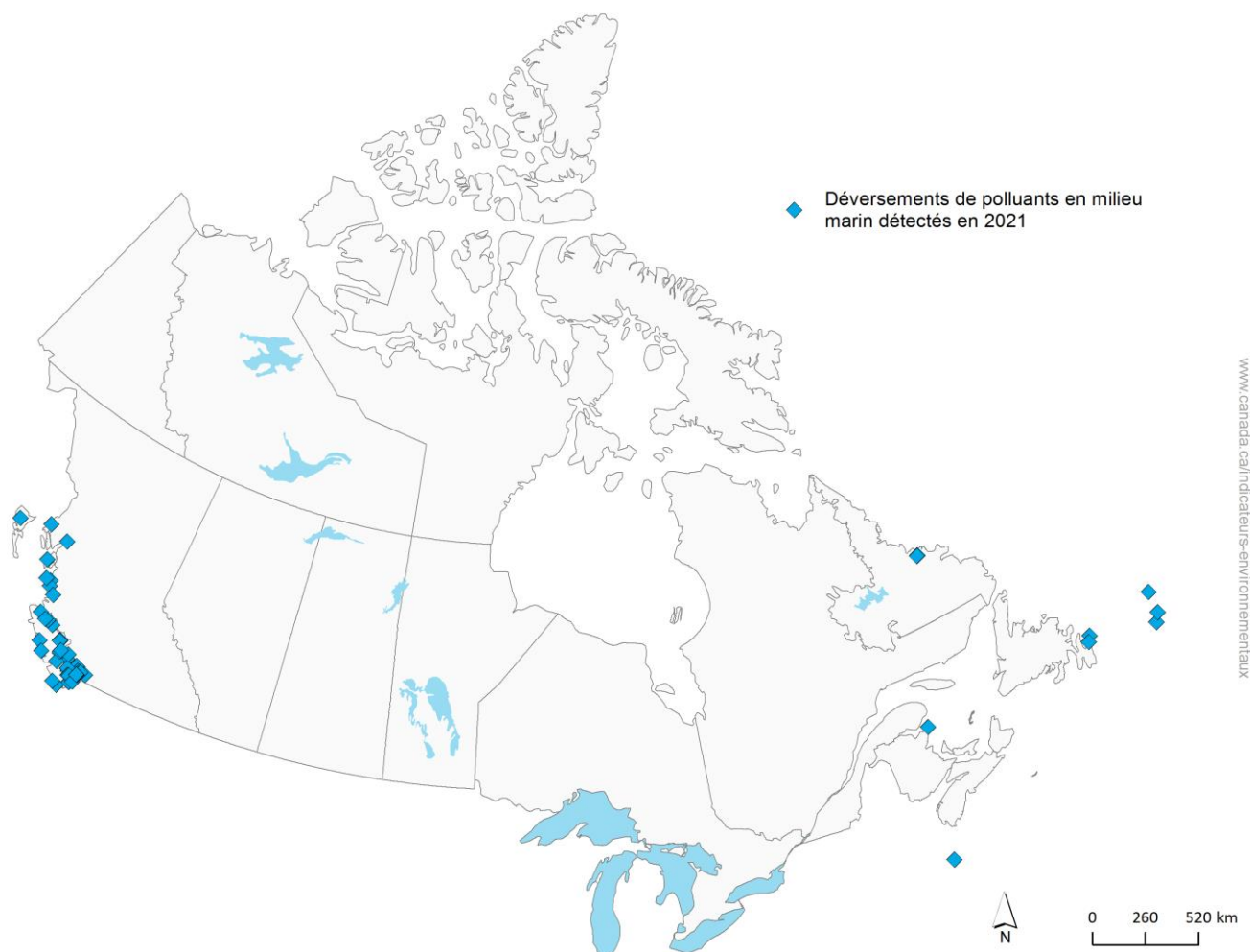
Figure 2. Déversements de polluants en milieu marin détectés, Canada, 2021

Remarque : Pour l'année 2021, seuls les déversements de plus de 10 litres ont été signalés. Le terme « année » fait référence aux exercices financiers, qui s'étendent du 1er avril au 31 mars. L'année 2021 commence donc le 1er avril 2020 et se termine le 31 mars 2021.