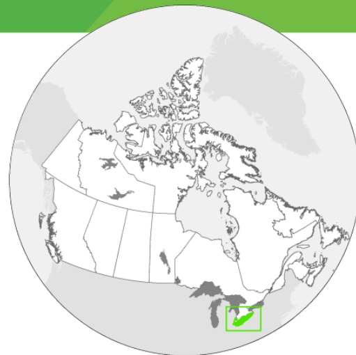
Tableau 1. Graphiques de la prolifération algale dans le Lac Érié (juin à octobre)

Contactez-nous au ec.EOLakeWatch-AttentionLacsOT.ec@canada.ca pour en savoir plus.