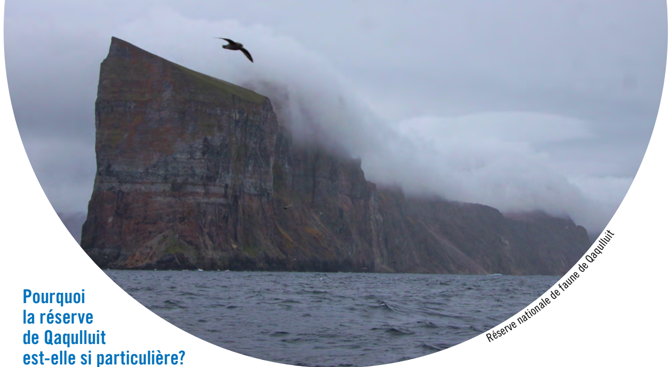
Réserve nationale de faune de Qaqqulluit