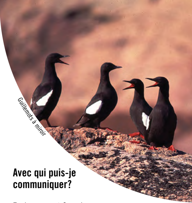
Guillemots à miroir