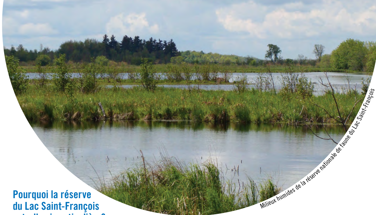
Milieux humides de la réserve nationale de faune du Lac Saint-François