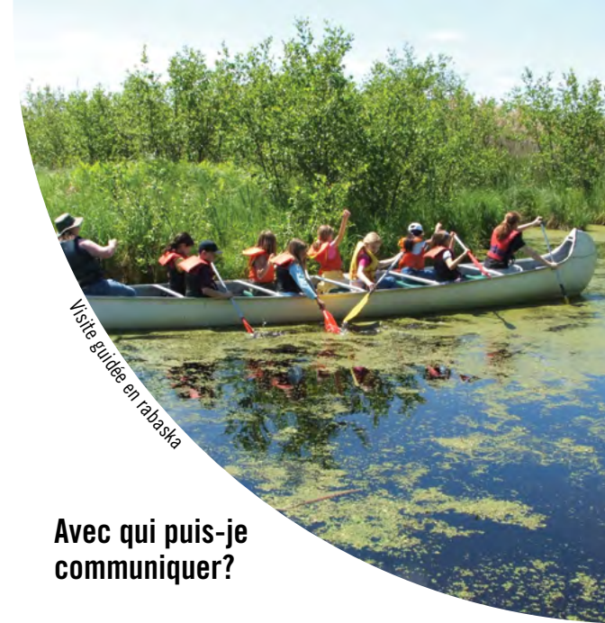
Visite guidée en rabaska