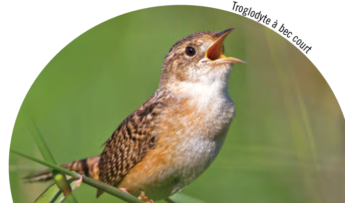
Troglodyte à bec court

Afin d'assurer la protection du milieu tout en permettant l'observation des espèces sauvages, l'accès à la réserve est limité à certaines périodes de l'année et à des endroits désignés. Les visiteurs peuvent faire de la randonnée pédestre et observer la flore et la faune, notamment les oiseaux, à partir d'une tour d'observation et de sentiers aménagés dans les divers écosystèmes de la réserve. Ils peuvent aussi découvrir les milieux humides en canot, en rabaska ou en kayak de mer, mais uniquement dans le cadre de visites guidées offertes par un organisme local autorisé par Environnement Canada.