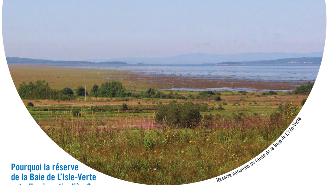
Réserve nationale de faune de la Baie de L'Isle-Verte