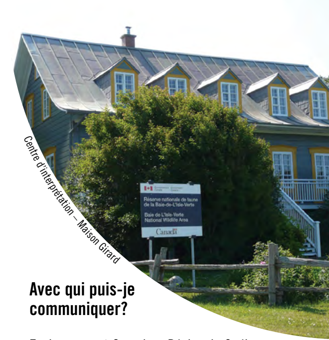
Centre d'interprétation - Maison Girard