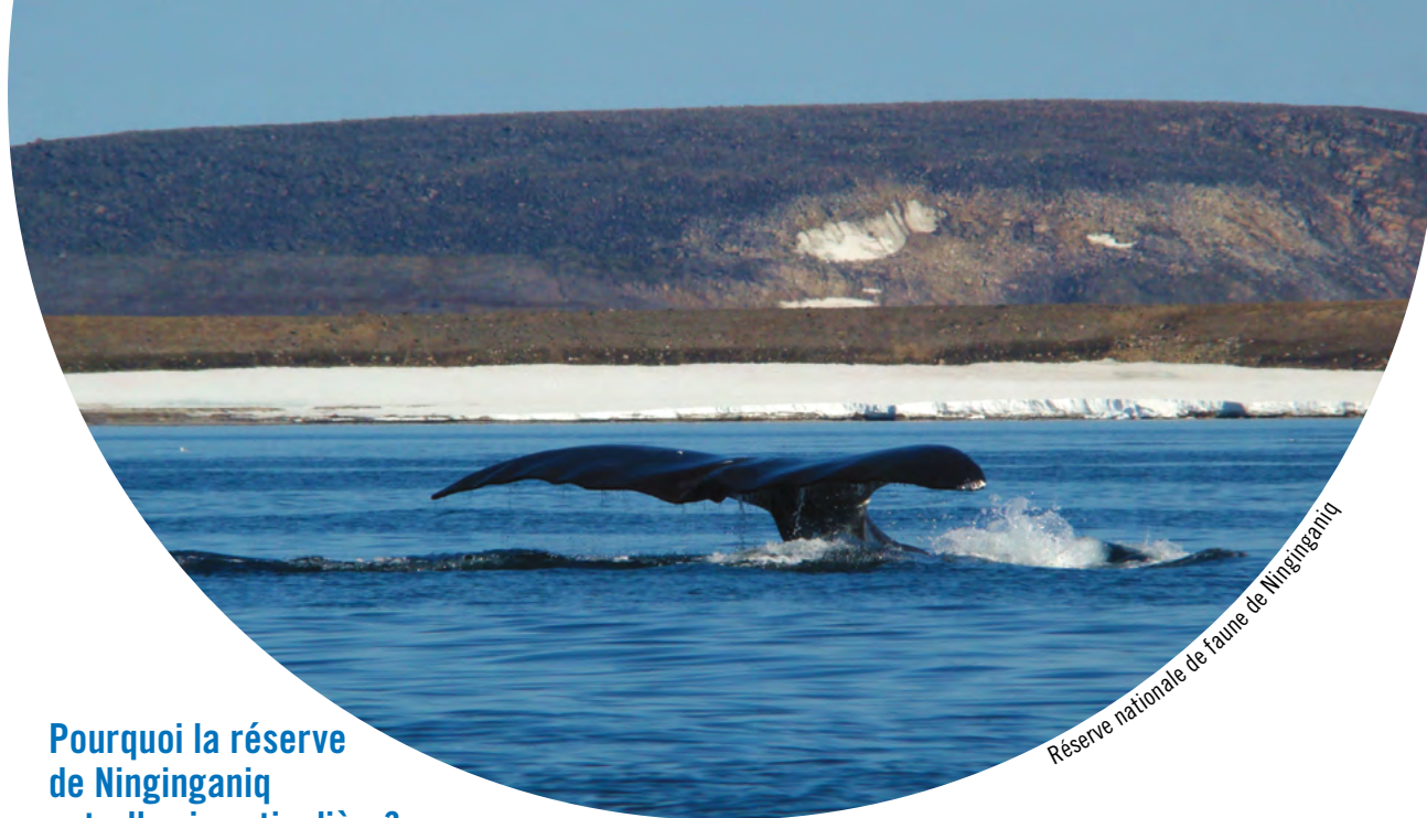
Réserve nationale de faune de Ninginganiq