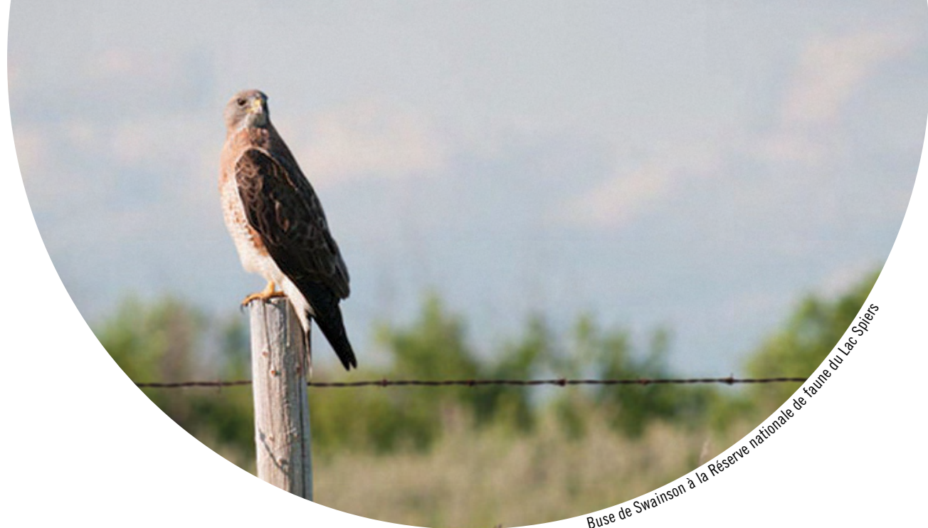
Buse de Swainson à la Réserve nationale de faune du Lac Spiers