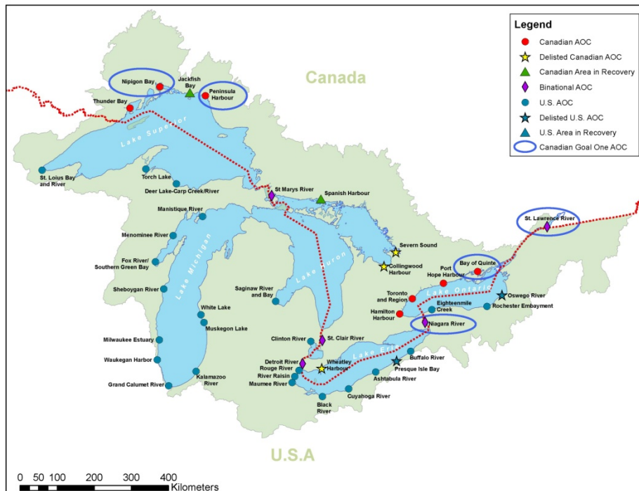
Carte des secteurs préoccupants des Grands Lacs

OBJECTIF 1 : MENER À TERME DES MESURES PRIORITAIRES POUR LE RETRAIT DE LA LISTE DANS CINQ SECTEURS PRÉOCCUPANTS : LA BAIE NIPIGON, LE PORT PENINSULA, LA RIVIÈRE NIAGARA, LA BAIE DE QUINTE ET LE FLEUVE SAINT-LAURENT (CORNWALL).