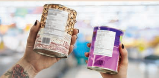
Āpacihtāk mīciwin kiskinawācihcikēwin