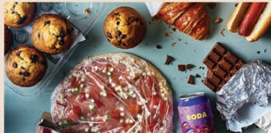
Āstamiyikohk āpacihtāk sīwīhtākan, sīwinikan ahpō pimīwastēw mīciwin