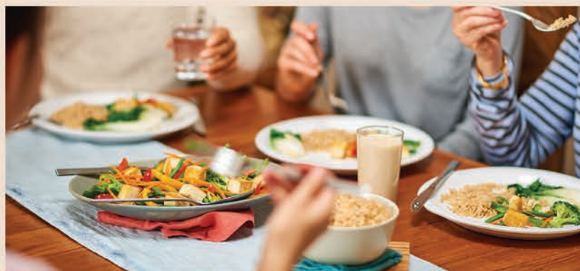
Mīcisok kotakak asici