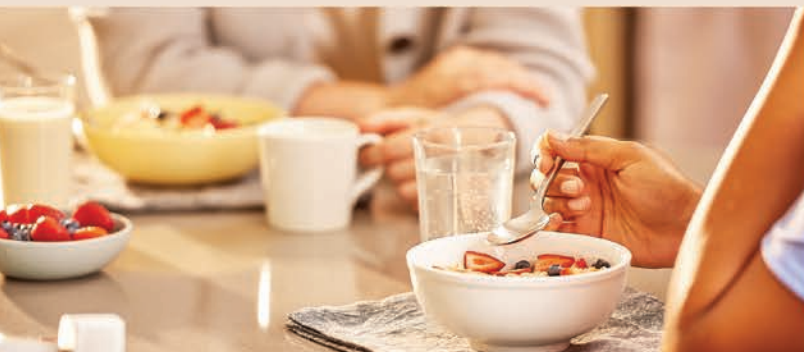
Aswēyihta ka-isi mīcisoyin

Maskawātisiw mīcisiwin nawac ayiwāk ōhi mīciwina ka-mīciyin