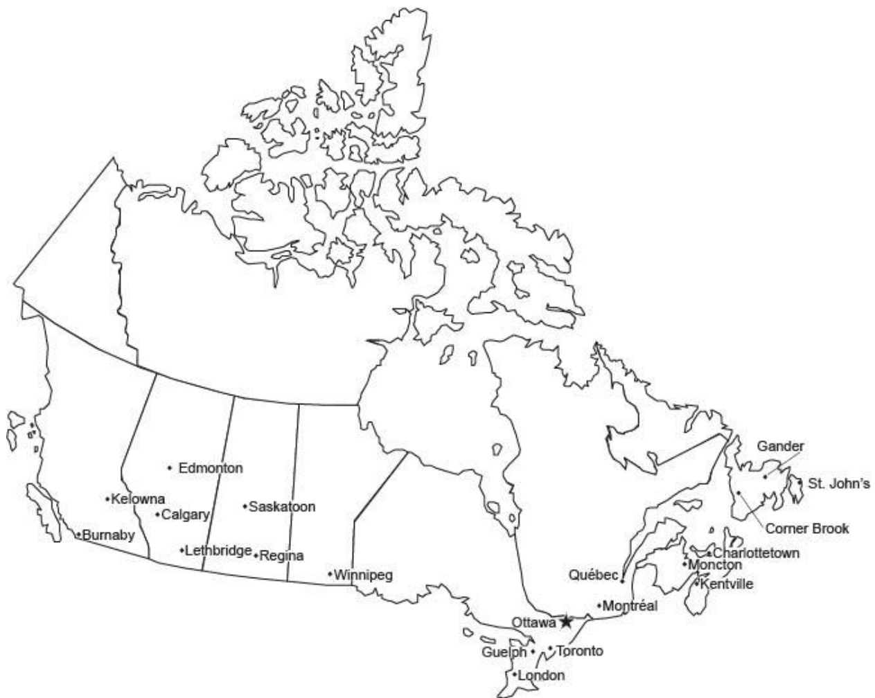
Figure 1. Carte des bureaux régionaux et de l'administration centrale (Ottawa)

Le Programme national de surveillance de la conformité des pesticides est coordonné depuis Ottawa et est mis en œuvre par les inspecteurs régionaux de Burnaby, Kelowna, Edmonton, Calgary, Lethbridge, Regina, Saskatoon, Winnipeg, London, Guelph, Toronto, Montréal, Québec, Ottawa, Moncton, Charlottetown et Kentville. À Terre-Neuve-et-Labrador, le Programme national de surveillance de la conformité des pesticides est mis en œuvre par les inspecteurs provinciaux de St. John's, Corner Brook et Gander. Le Programme national de surveillance de la conformité des pesticides dispose d'un laboratoire situé à Ottawa.