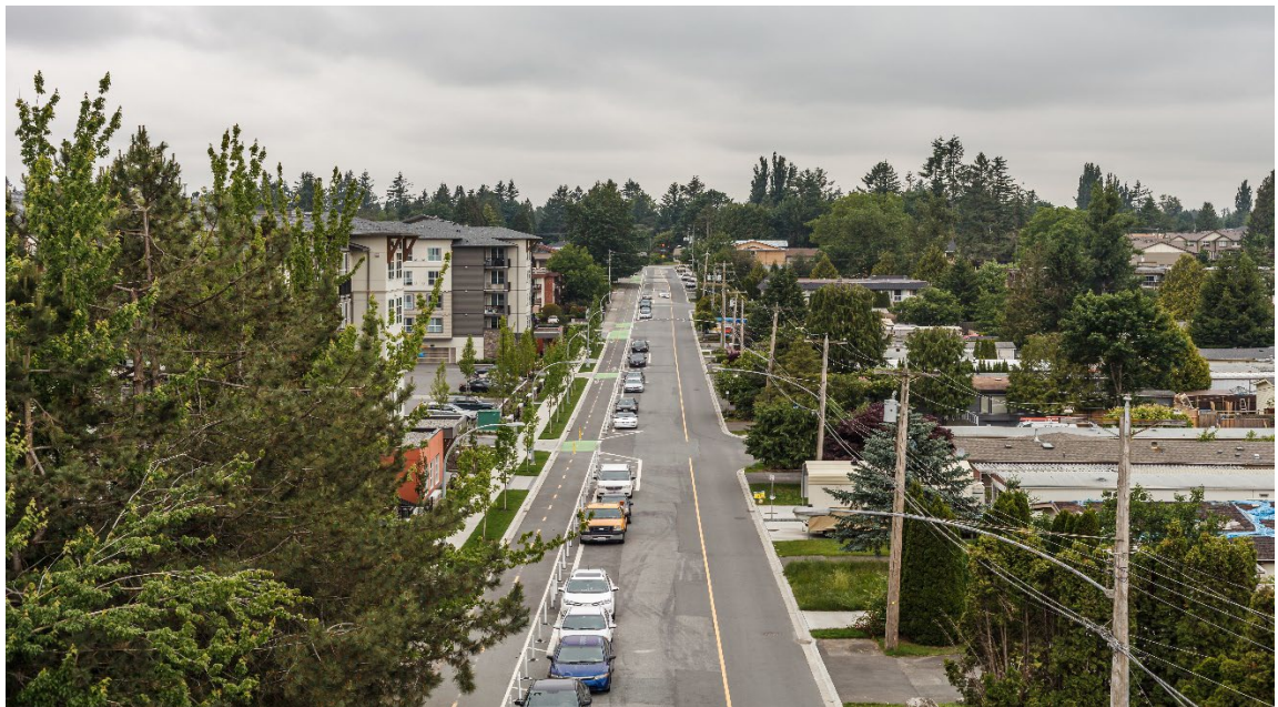
نمای سرک بشمول سازه‌های مسکونی در ابوتس‌فورد، فصل بهار.

مردم بومی قبل از ورود مهاجرین و سیاحین اروپایی به کانادا در این کشور زندگی می‌کردند. ابوتس‌فورد در زمین سنتی اقوام اولیه ماتسکی و سوماس قرار دارد.