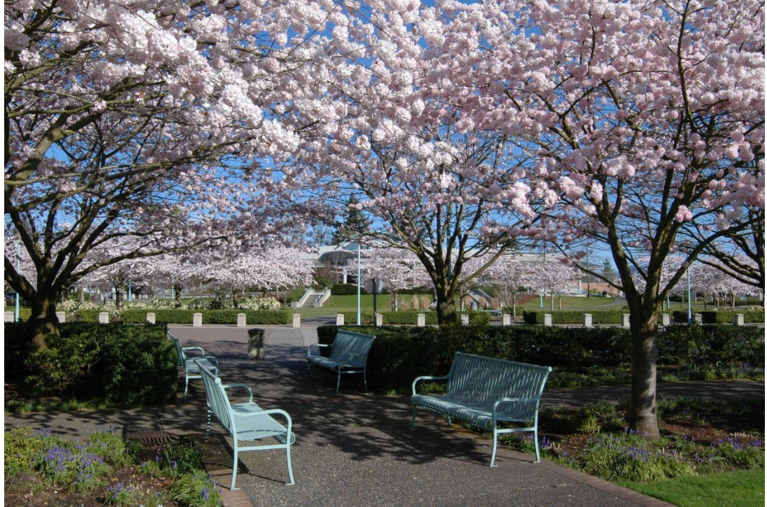
شکوفه‌های گیلاس در بهار، ابوتس‌فورد، بریتیش کلمبیا.