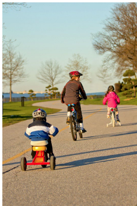
بایسکل‌سواری سه‌چرخه در امتداد ساحل ویندسور، فصل بهار.

مردم بومی قبل از ورود مهاجرین و سیاحین اروپایی به کانادا در این کشور زندگی می‌کردند. ویندسور سرزمین سنتی آنی‌شینابه از «شورای سه آتش» اقوام اولیه، شامل مردم اوجیبوه، اوداوا و پوتاواتومی، است.