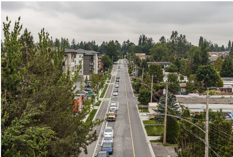
Vue sur la rue d'un logement résidentiel d'Abbotsford au printemps.

Les peuples autochtones vivaient au Canada bien avant l'arrivée des colons et des explorateurs européens. Abbotsford est située sur le territoire traditionnel des Premières Nations Matsqui et Sumas .