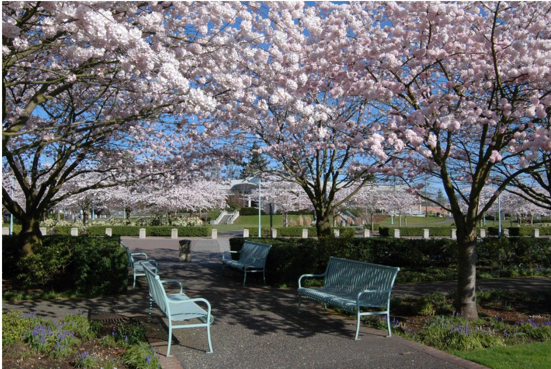
Cerisiers en fleurs au printemps, Abbotsford, C.-B.