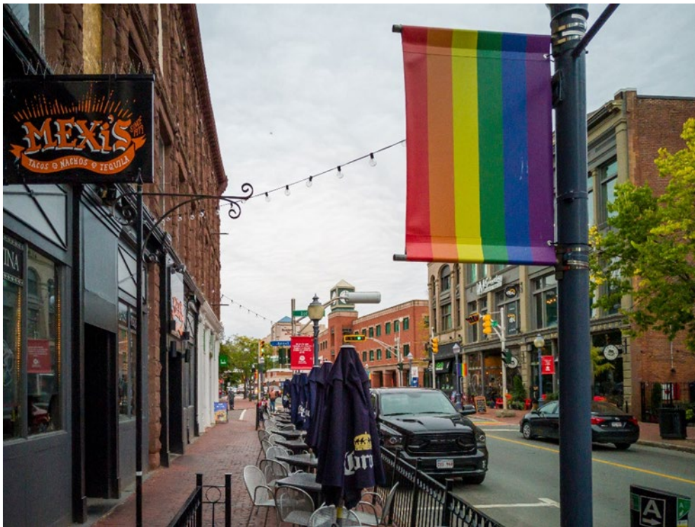
Centre-ville de Moncton.

Les peuples autochtones vivaient au Canada bien avant l'arrivée des colons et des explorateurs européens. Moncton, comme une grande partie du Nouveau-Brunswick, est située sur le territoire traditionnel des Premières Nations Malécite et Mi'kmaq (Meeg-mah).