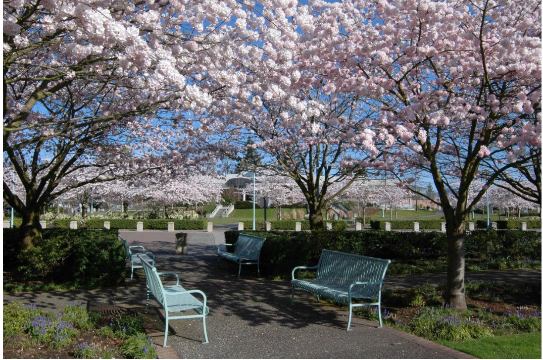
په پسرلي کې د الوبالو کلونه، ابيټسفورډ، برتانوي کولمبيا.