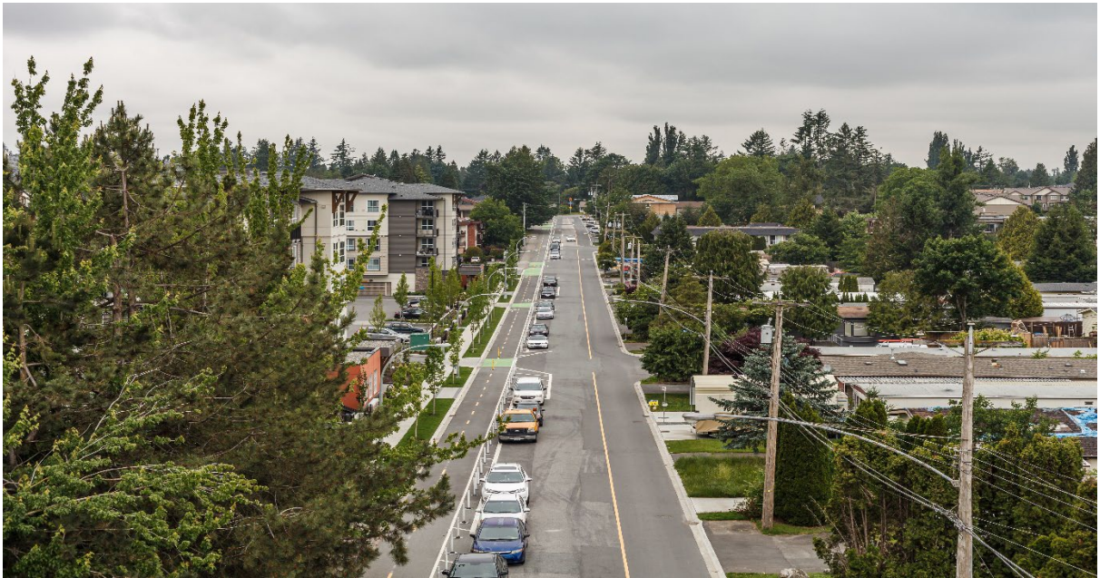
د پسرلي پر مهال د ابيټسفورډ د استوگنځايونو او د سرکونو ننداره.

د دې خاي خلک په کاناډا کې له اروپايي ميشتو او هغو خلکو له رسيدو څخه مخکې دلته اوسيري چې دغه ځمکه يې د لومړي ځل لپاره کشف کړې وه. ابيټسفورډ د ماتسکي او سماس د لومړنيو مليتونو په دوديزه سيمه کې موقعيت لري.