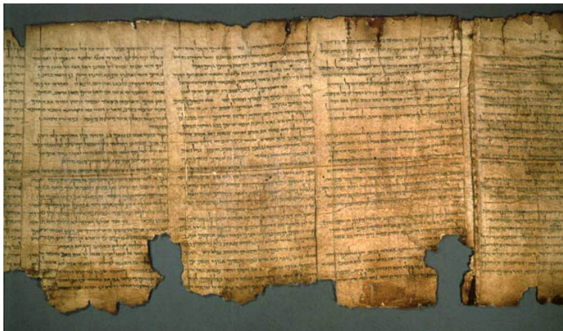
Isaiah Scroll (1QIsaa) Written in Hebrew - Qumran, Cave 1. Ca. 120 BCE Parchment