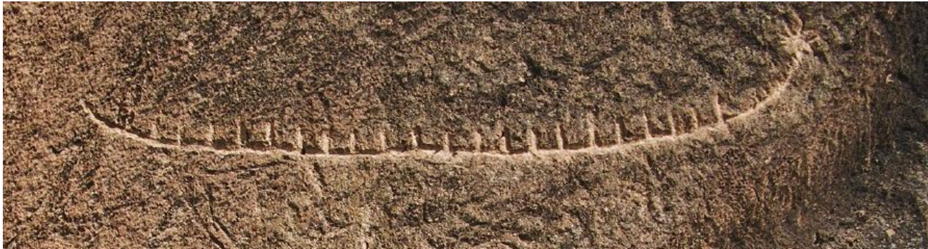
Pétroglyphe de bateau – parc national de Gobustan, Azerbaïdjan. environ 10 000 av. J.-C.