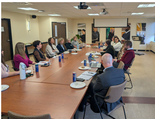
Dialogue d'écoute & découverte à l'Université de Sherbrooke