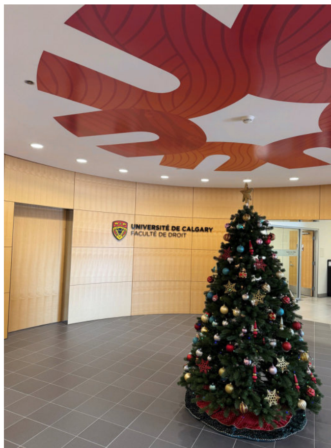
Faculté de droit de l'Université de Calgary