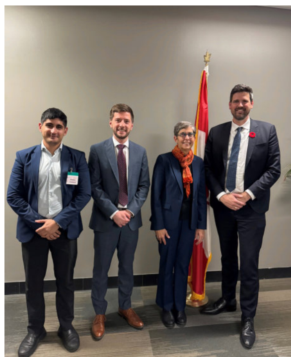
Rencontre avec le Ministre de la Justice, l'honorable Sean Fraser