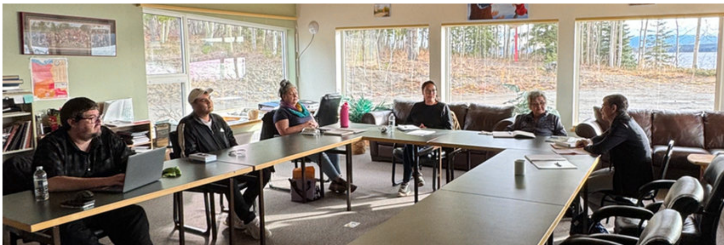
Rencontre avec le Conseil de justice des Tlingits de Teslin