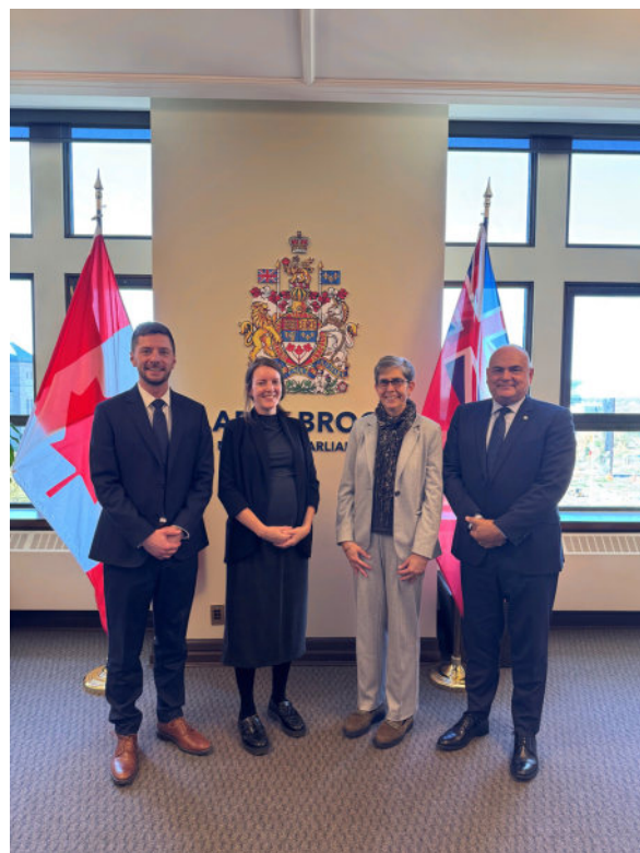
Rencontre avec le député Larry Brock

En novembre, nous avons rencontré le ministre de la Justice et procureur général du Canada, l'honorable Sean Fraser. Nous lui avons présenté certains des travaux fondamentaux que nous avons réalisés depuis la reprise de nos activités à l'été 2023, lui avons fourni des mises à jour et des informations sur nos nombreuses initiatives en cours, et avons discuté de certaines des façons dont la CDC pourrait contribuer de manière significative aux questions qui touchent les Canadiens.