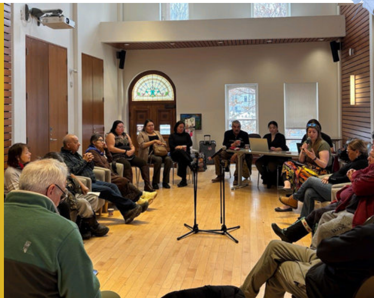
Aînés, porteurs du savoir, professeurs et étudiants à la table ronde Waskapitan Pimatisiwin Otcî