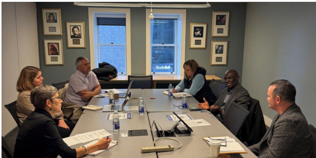
Cercle de discussion de Calgary