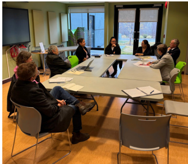
Dialogue d'écoute & découverte à Whitehorse