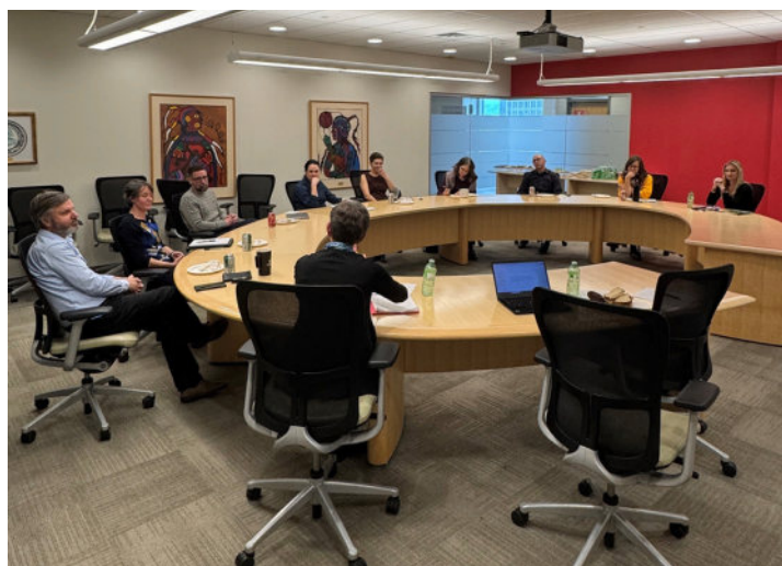
Dialogue d'écoute & découverte à l'Université de Calgary

Au cours des derniers mois de l'année, la CDC a poursuivi ses efforts pour établir des liens avec les facultés de droit à travers le pays, en présidant des Dialogues d'écoute et découverte avec des chercheurs de l' Université de Sherbrooke en novembre et de l' Université de Calgary au début de décembre. Les universitaires ont identifié les questions sur lesquelles ils travaillent actuellement ou qui, selon eux, se profilent à l'horizon, et ont discuté de certaines des façons dont celles-ci pourraient recouper la mission mission de la CDC. Merci aux interlocuteurs d'avoir partagé leur temps, leurs réflexions et leur sagesse!