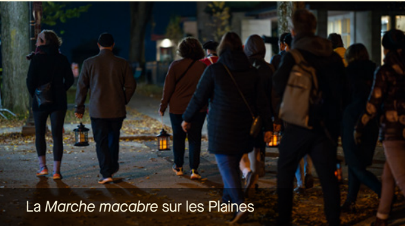
La Marche macabre sur les Plaines