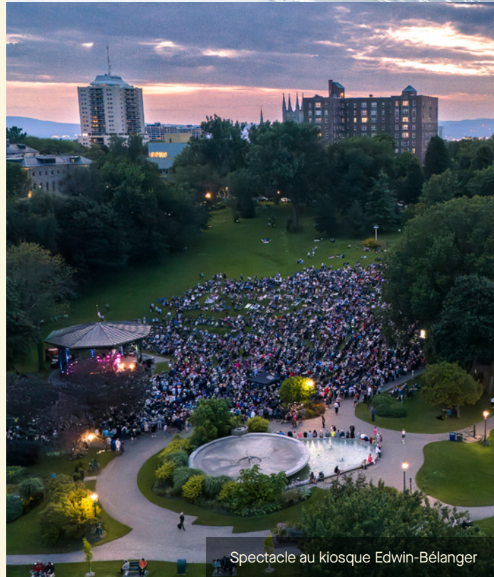
Spectacle au kiosque Edwin-Bélanger

Au cours de la saison estivale, la Commission a proposé différentes activités pour explorer le parc et son histoire. Les enfants ont ainsi pu résoudre les énigmes amusantes de la chasse aux trésors La cachette de l'architecte tandis que les plus grands ont relevé les défis des jeux d'évasion extérieurs Le défi des grandes guerres et Les oubliés et du jeu d'évasion La Tourmenteuse à la tour Martello 4. La visite animée en autobus a aussi conduit les visiteuses et visiteurs dans les lieux mémorables des Plaines avec un personnage en costume d'époque qui leur racontait l'histoire du parc.