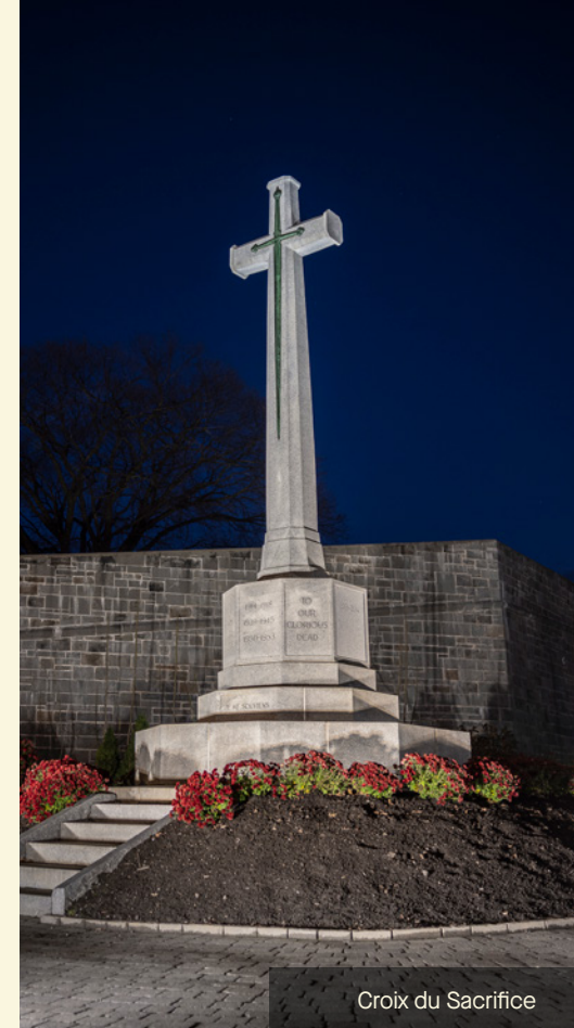
Croix du Sacrifice

Au cours de la dernière année, des travaux ont également été réalisés au jardin Jeanne-d'Arc afin d'entretenir la statue Jeanne-d'Arc et d'effectuer la réfection du muret de pierres qui entoure les plates-bandes.