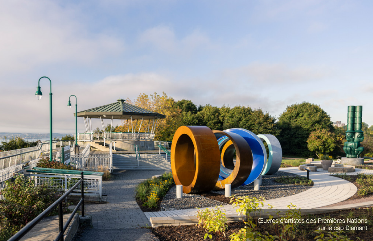
Œuvres d'artistes des Premières Nations sur le cap Diamant