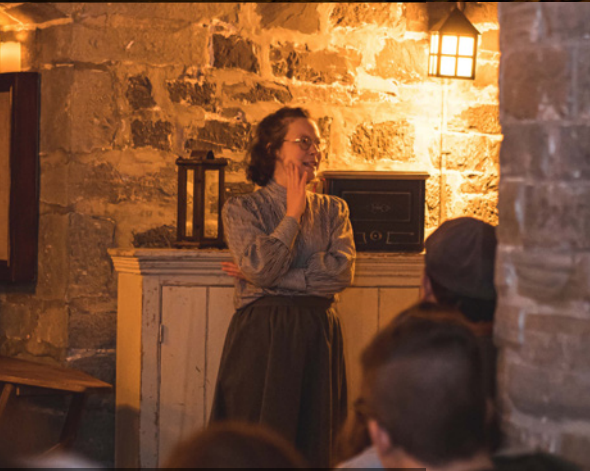
Activité Horreurs du bon vieux temps dans la tour Martello 4