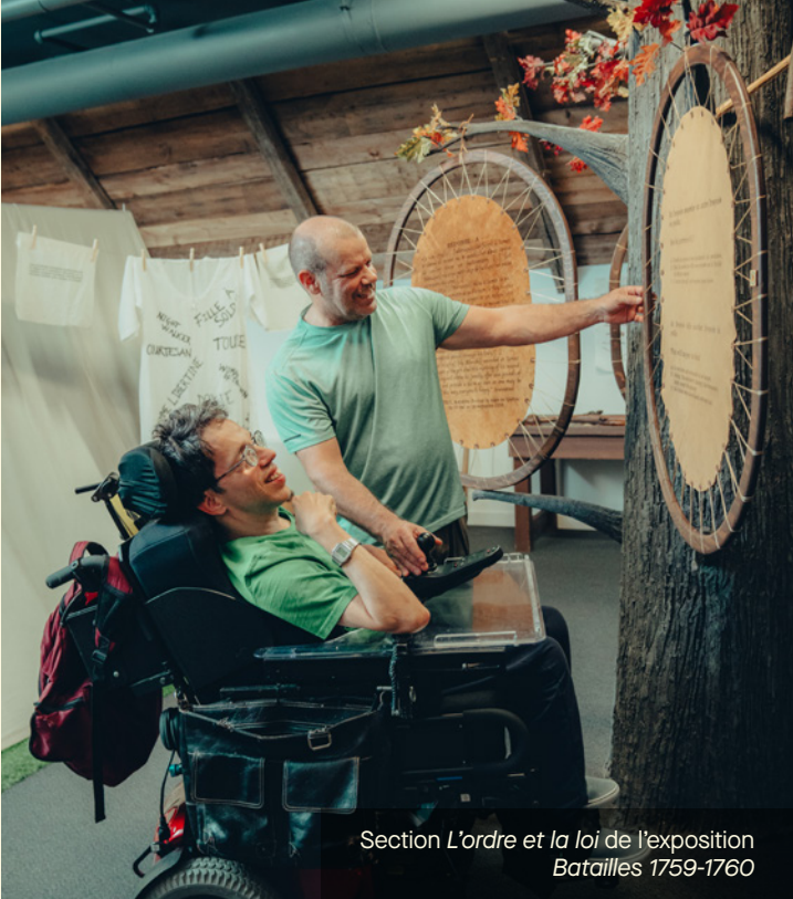
Section L'ordre et la loi de l'exposition Batailles 1759-1760

Les visiteuses et visiteurs du Musée des plaines d'Abraham ont pu profiter de l'exposition temporaire Québec 1775 : enneigée et assiégée inaugurée en juin 2024 ainsi que de l'exposition permanente Batailles 1759-1760 . L'exposition Identités a, quant à elle, pris fin en décembre 2024 pour laisser place à la nouvelle section Les vestiges qui sera accessible à compter du printemps 2025.