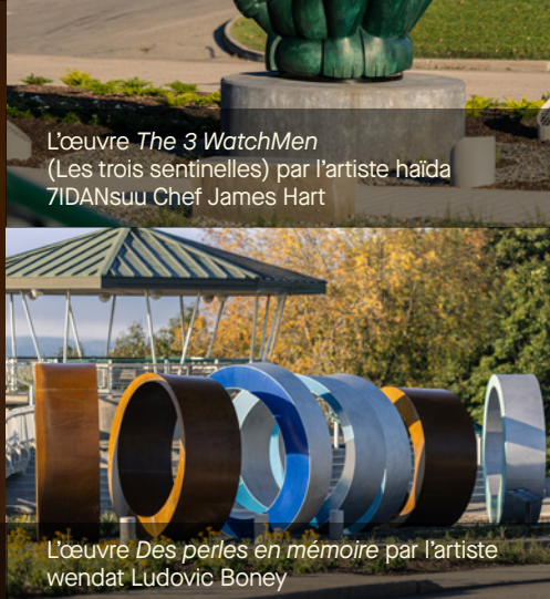
L'œuvre Des perles en mémoire par l'artiste wendat Ludovic Boney