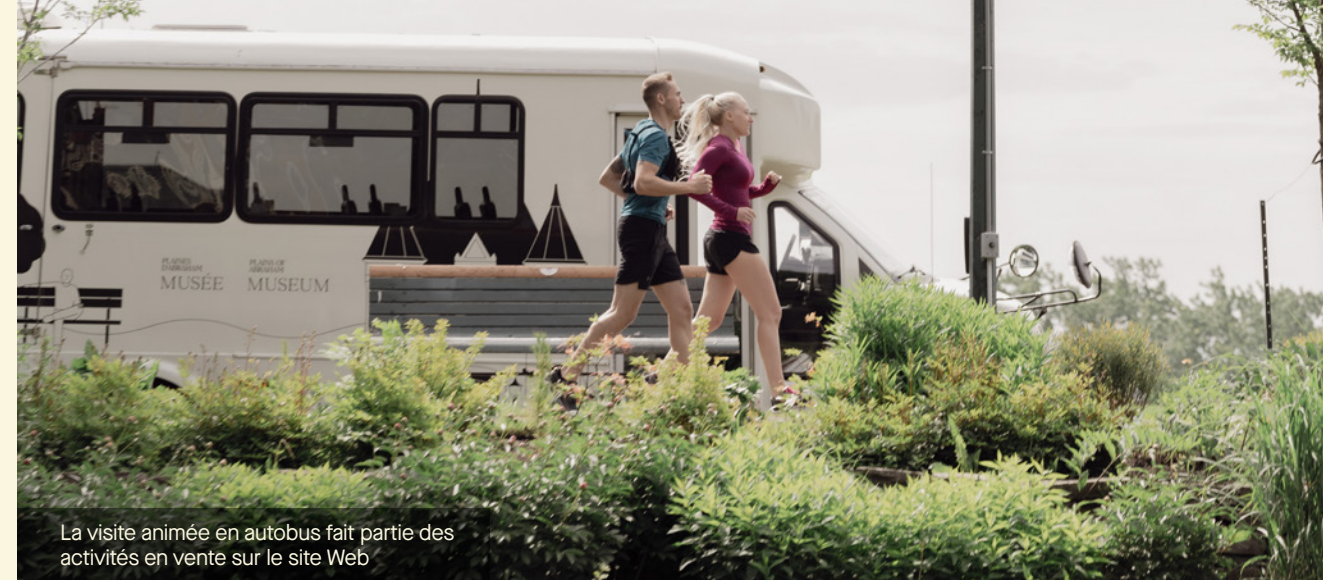
La visite animée en autobus fait partie des activités en vente sur le site Web

Le café est ouvert tout au long de l'année avec des places intérieures et extérieures. La terrasse offre une vue incroyable sur les aménagements floraux du parc et sur la fontaine du Centenaire. En hiver, les pistes de ski de fond passent à proximité et un support à skis facilite l'accès aux sportifs.