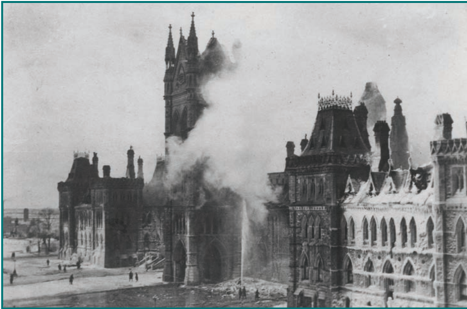
PHOTO DE L'INCENDIE DE 1916