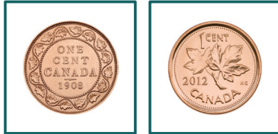
Pièce d'un cent de 1908, et la dernière pièce d'un cent émise en 2012.