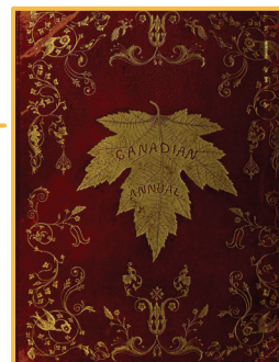
Plat verso de l'annuaire littéraire The Maple-Leaf , 1848.

L'annuaire littéraire The Maple-Leaf appelle la feuille d'érable « l'emblème élu du Canada ». Une feuille d'érable dorée se trouve sur sa couverture.