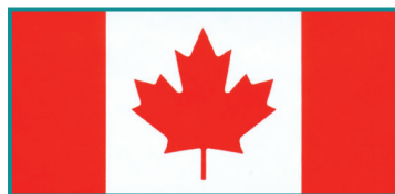
Le drapeau national du Canada

Le Grand débat sur le drapeau. La plupart des milliers de concepts de drapeau envoyés par des Canadiens sont ornés d'une feuille d'érable.