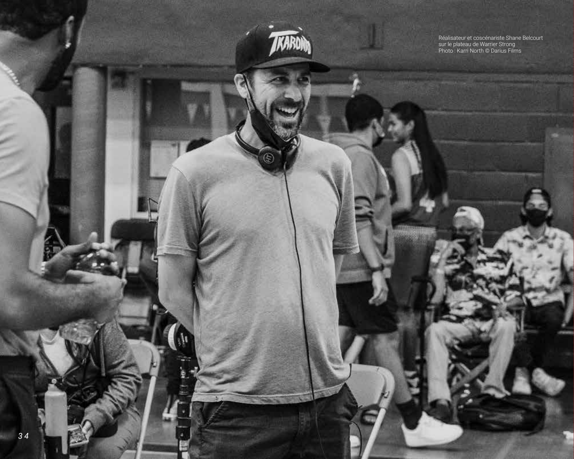
Réalisateur et coscénariste Shane Belcourt sur le plateau de Warrior Strong