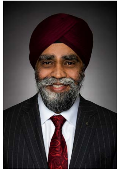
L'honorable Harjit S. Sajjan Ministre du Développement international et ministre responsable de l'Agence de développement économique du Pacifique Canada

Le gouvernement du Canada est déterminé à faire en sorte que les Canadiens sortent de la pandémie encore plus prospères qu'avant. Le chemin à parcourir sera semé d'embûches, mais il ouvre la voie à une mine de possibilités. Nous avons une histoire passionnante à raconter à propos de cette province. Je vous invite à lire ce plan afin de connaître les mesures qu'entend adopter PacifiCan pour appuyer fermement la réussite économique des Britanno-Colombiens.