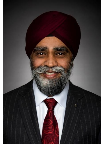
L'honorable Harjit S. Sajjan Ministre du Développement international et ministre responsable de l'Agence de développement économique du Pacifique Canada

Je vous invite à lire ce plan pour en savoir davantage sur la façon dont PacifiCan deviendra un partenaire encore plus fort pour les Britanno-Colombiens.