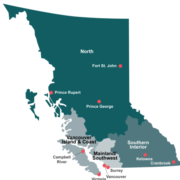
Figure 1 : Carte des régions et des bureaux de PacifiCan

Environ 40 % des Britanno-Colombiens vivent dans des collectivités situées à l'extérieur du Lower Mainland. En 2022-2023, PacifiCan a ouvert sept nouveaux bureaux, soit à Campbell River, à Cranbrook, à Fort St. John, à Kelowna, à Prince George, à Prince Rupert et à Victoria. Ces nouveaux bureaux aideront les Britanno-Colombiens de toute la province à accéder au personnel et aux ressources de PacifiCan en vue d'élaborer des stratégies économiques solides. La plus grande présence de PacifiCan sur le terrain dans toute la province permettra d'approfondir les liens avec les collectivités et les entreprises, et permettra à l'Agence de répondre aux besoins locaux.