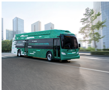
Bus électrique à pile à combustible New Flyer Xcelisior CHARGE FC™. Photo utilisée avec l'autorisation de NFI Group Inc.

Selon Paul Soubry, président-directeur général, « les Prairies offrent un accès privilégié aux talents locaux et un écosystème favorable qui permet à NFI de stimuler l'innovation et d'offrir des transports plus intelligents, plus sûrs, plus durables et connectés ».