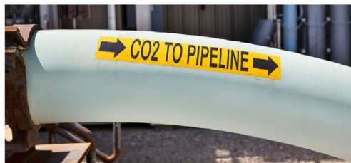
Le pipeline de l'installation Quest CCS.

L'installation de captage et de stockage de carbone (CSC) Quest exploitée par Shell et située près d'Edmonton, en Alberta, a permis de capter et de stocker plus de 8 millions de tonnes de CO 2 depuis son ouverture fin 2015. Les résultats de Quest, combinés à l'expertise de classe mondiale en développement et en exploitation d'installations de CSC des Prairies, ouvrent la voie à une réduction considérable des émissions de gaz à effet de serre dans le secteur énergétique traditionnel et suscitent l'intérêt d'entreprises du secteur énergétique de partout dans le monde.