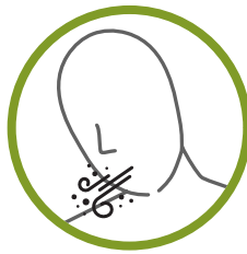
Dene delkoth ts'ethıé