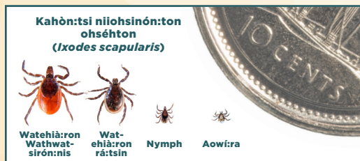
Tsi nitawé:nón ne ohséhton kaia'tarónnion: URI TickEncounter Resource Center

Iotkà:te, iakononhwaktanihens nó:nen nitioión:'a ohséhton aiakoká:ri né:ne nymph konwá:iats né:ne sha'té:wa ne iotshihkón:ni aonénha. Ionatehiá:ron ohséhton (thóha sha'té:wa ne sesame aonénha) ne ò:ni enwá:ton aiakononhwakténhseron ne Lyme raónhra. Kwah í:ken nikonná:sas ne ohséhton táhnon ens iah teiononhwákte nó:nen aiakoká:ri, tho kí' ta'nón:wa iah tesaterièn:tare tsi saká:rión.