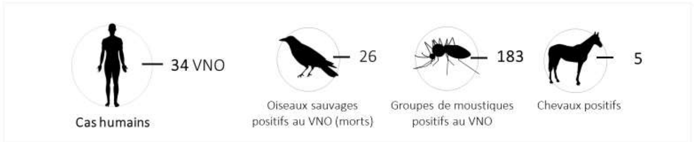
Figure 1. Répartition géographique du VNO chez l'humain (cas cliniques et infections asymptomatiques) et chez les oiseaux positifs signalés au Canada, 2020