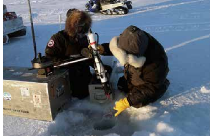
Haumingnit Taliqpingnut Tommy Epakohak (haumikhia) unalu Ryan Angohiatok uniaqtangit CTD ingilrutingat tatpaunga hikumit hulivlutik CROW 2020 haniani Finlayson Qikiqtangit: Mike Dempsey

Uktuutigijangit naittumik ilanganit ikaarnianut Dease Ikirahak unalu Ikirahak ikajuqhimajangit qaujihaqtit kangiqhimagiangani qanuq tarjuq imanga utiqattaqtut kaivigaangat Qitirmiut nunangani haffumani Ukiuqtaqtuq Uataa Ikaarvinga. Imat iluanunngaqtut uvannat Kiillingujaq Iluiliq ilagijaujut aturluarnaqtut avikuqhimajumi angiklijuummiqtuq halumajumi imaqt uvannat ahiaq nunangani kuugait.