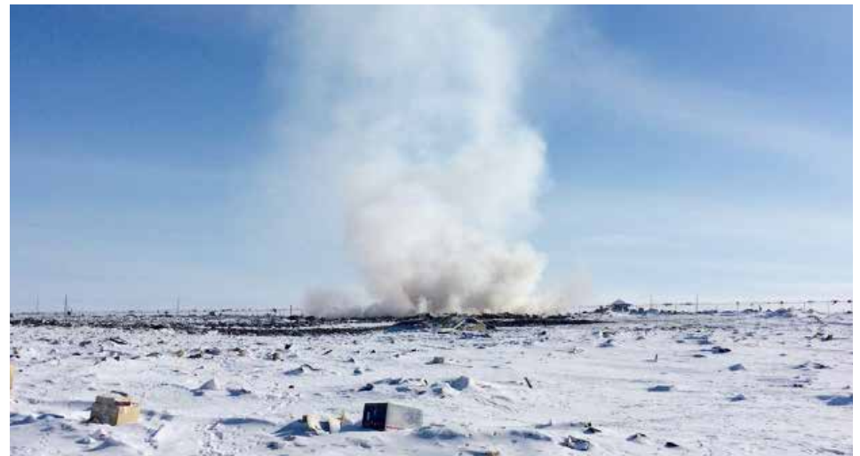
Ikulahimajuq iqqakuutit uvani Iqaluktuuttiaq nunap iluani. Ikulavagaat taimaa iqqaqpaagaat amihunut unguhiktumi nunaliit: POLAR

Havaatigut hivuliqtuujut: Rob Cooke, Ukiuqtaqtumi Qaujijamangit Kanata (POLAR), info@polar.gc.ca