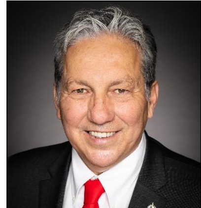
L'honorable Dan Vandal ministre des Affaires du Nord, ministre responsable de Développement économique Canada pour les Prairies et ministre responsable de l'Agence canadienne de développement économique du Nord

Le gouvernement du Canada est déterminé à favoriser la réconciliation avec les peuples autochtones en bâtissant un avenir plus propre et plus vert grâce à des efforts soutenus et concertés, en faisant la promotion du développement économique et en créant des emplois. POLAIRE continue de concentrer son travail sur ces priorités dans le Nord et l'Arctique, tout en renforçant le leadership du Canada en matière de sciences et de technologies polaires.